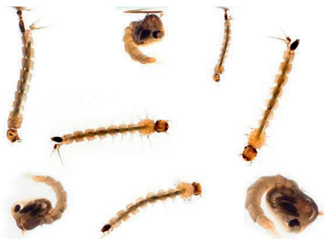
Kukuljice i ličinke komarca

Životni ciklus komaraca počinje polaganjem jajašaca na ili uz stajaću vodu, nakon čega se pri odgovarajućoj temperaturi nakon jednog ili više tjedana preko stadija kukuljice i ličinke razvije odrastao komarac.